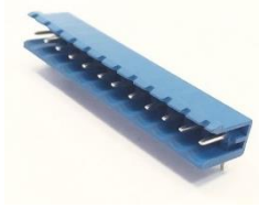
5,08 mm SBDK-E 180° Açık (10.362)