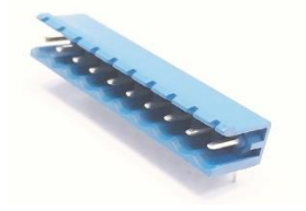
5,08 mm SBDK-E 180° Açık (10.360)