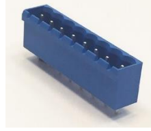
5,08 mm SKBK (10.608)