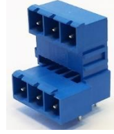
7,62 mm SBDK-KE2 (10.975)