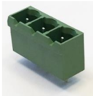
7,62 mm SKBK (10.903)